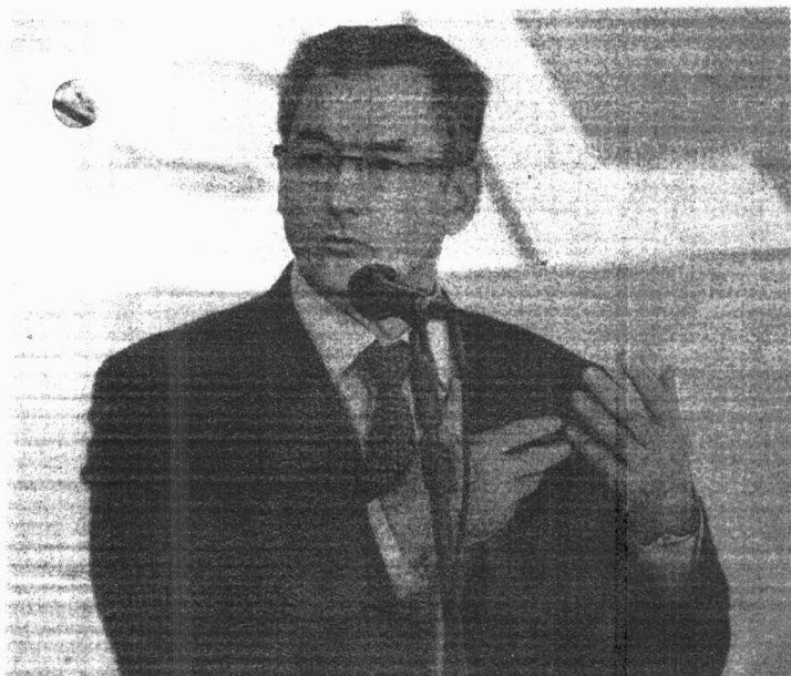
Os litígios sobre PIS/Cofins representam cerca de 80% dos processos do Carf, segundo informou o ministro Eduardo Guardia.

Guardia afirmou estar otimista sobre a possibilidade de o Congresso debater o tema ainda este ano, mesmo em meio ao calendário eleitoral. "O Congresso tem respondido aos nossos pedidos; olhe tudo o que foi feito de reformas nesse país", declarou. Ele afirmou ter "convicção de que haverá espaço para aprovar temas dessa relevância".