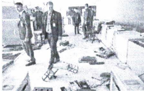
PALÁCIOS dos Três Poderes foram parcialmente destruídos