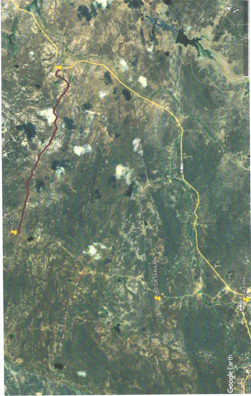
Figura 2 - Mapa de localização do trecho em relação à sede do município e em relação à jazida