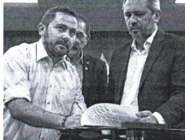
JUNTO de Elmano, ele assinou a lei que fixa um piso para advocacia na OAB-CE

"Isso será necessário para atrair vários novos investimentos. Por exemplo, nós vamos ter agora toda a cadeia de hidrogênio verde, que vai requerer profissionais qualificados. Além disso, serão gerados